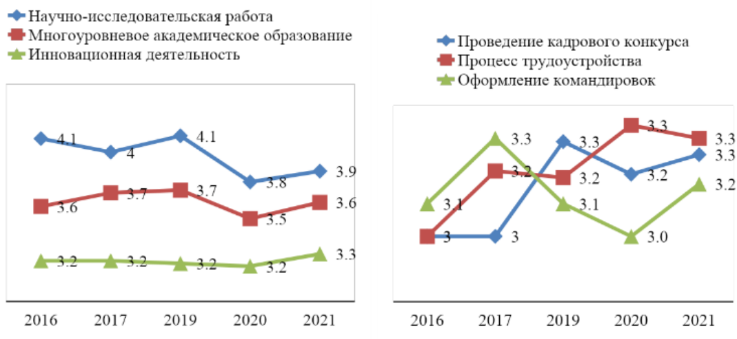
Рисунок 2. График изменения средних оценок преподавателями качества основных и второстепенных процессов в ТГУ . Вопрос: “Оцените по 5 балльной шкале качество различных процессов ТГУ” (где 1 - минимальная оценка, 5 – максимальная)