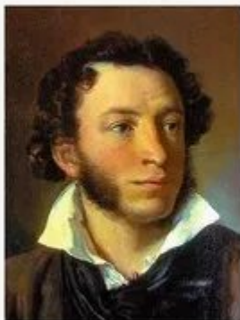
А. С. Пушкин (1799-1837 гг.)

Бранил Гомера, Феокрита; Зато читал Адама Смита И был глубокой эконом, То есть умел судить о том, Как государство богатеет, И чем живет, и почему Не нужно золота ему, Когда простой продукт имеет.