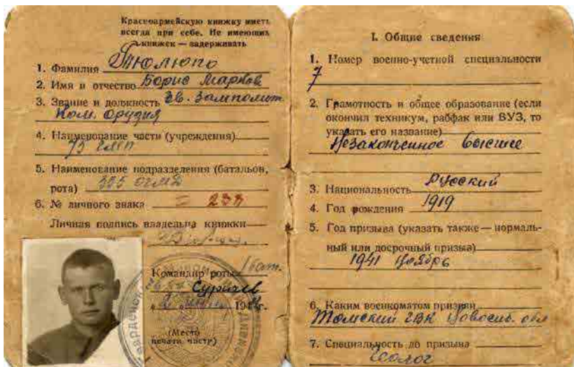
Красноармейская книжка студента-фронтовика Б. Тютюпо