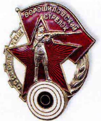
Значок «Ворошиловский стрелок»