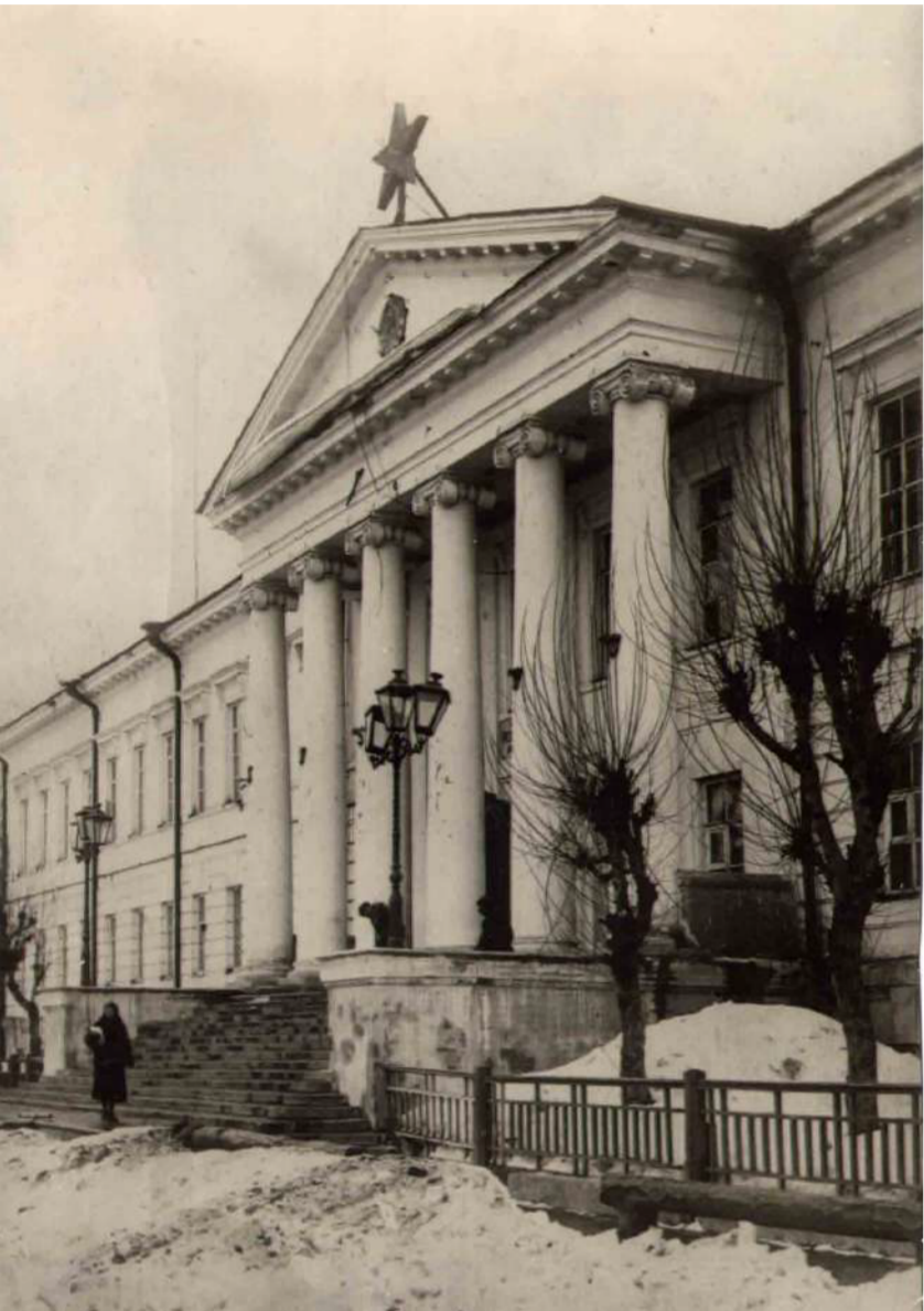
СФТИ – здесь проводились научные исследования для нужд фронта