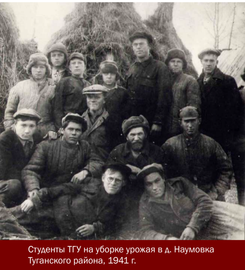
Студенты ТГУ на уборке урожая в д. Наумовка Туганского района, 1941 г.