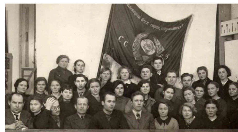
Преподаватели и студенты спецфака, 1943 г.