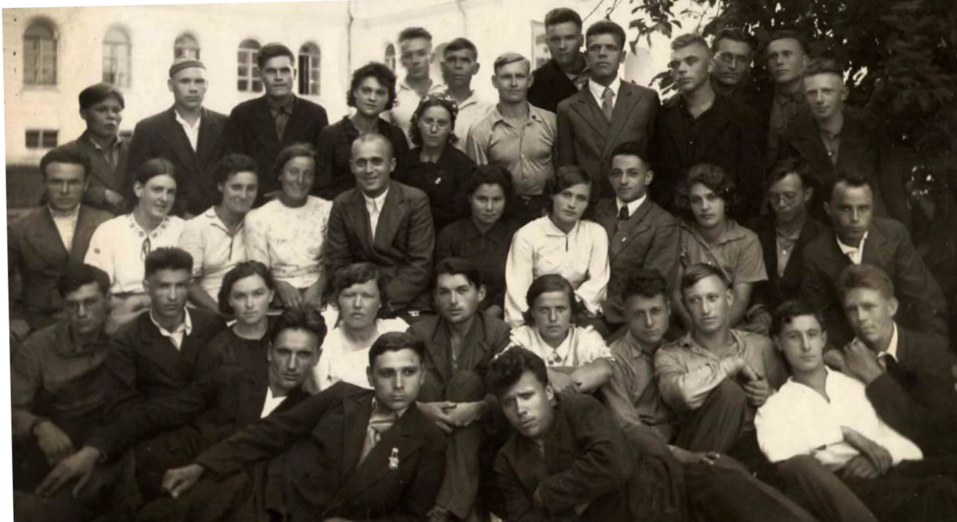
Досрочный выпуск физико-математического факультета, 1941 г.