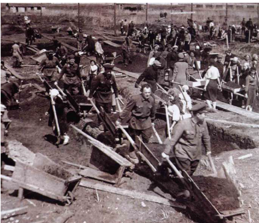
Сотрудники и студенты на строительстве железнодорожной ветки к ТЭЦ-1, 1942 г.