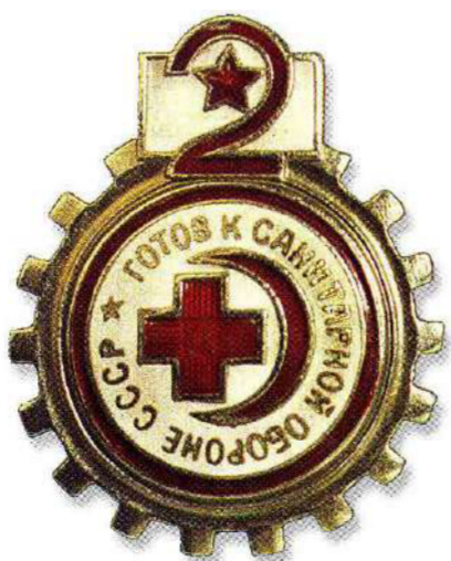
Значок «Готов к санитарной обороне СССР»