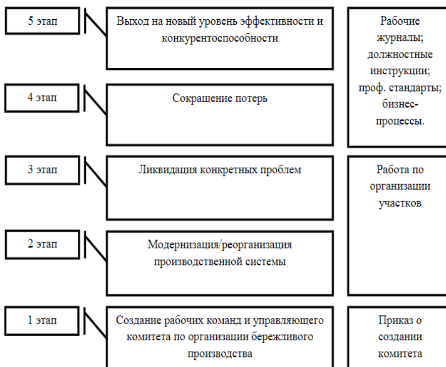
Рисунок 1. – Этапы внедрения бережливого производства

В последние годы развитие предприятий Полимерного кластера Санкт-Петербурга вышло на новый качественный уровень. Помимо освоения новых методов обработки пластмасс и системного подхода к управлению производством в целом, на предприятии были разработаны профессиональные стандарты и начато внедрение бережливого производства. Бережливое производство представляет собой концепцию ведения бизнеса, направленную на минимизацию потерь в производственном процессе. В реализацию нововведения вовлечены все уровни специалистов предприятия, начиная с директоров, отвечающих за формирование экономической и организационной основы внедрения концепции, и заканчивая литейщиками. Главная задача - повышение производительности на предприятиях кластера с целью роста конкурентоспособности выпускаемых изделий. Бережливое производство должно распространиться на все компании кластера, чтобы изменения принесли системный эффект. Пилотным же предприятием по вводу данной концепции стало ООО «Чудо-Ярмарка». Проект стартовал в апреле 2014 года. Для более эффективного внедрения бережливого производства был приглашён представитель международной компании «Solving Efeso», занимающейся поддержкой реализации организационных проектов. Учитывая специфику производства и уникальные стороны компании, были сформированы следующие этапы реализации проекта