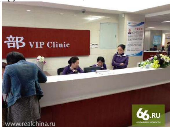
Вообще, VIP-отделения есть в любых китайских учреждениях. Что бы это ни было. Я почти уверен, что они есть даже в торговых.

В этом случае в больнице предусмотрено VIP-отделение. Количество китайских миллионеров в абсолютном выражении исчисляется миллионами. Разумеется, никто не игнорирует этот слой общества.